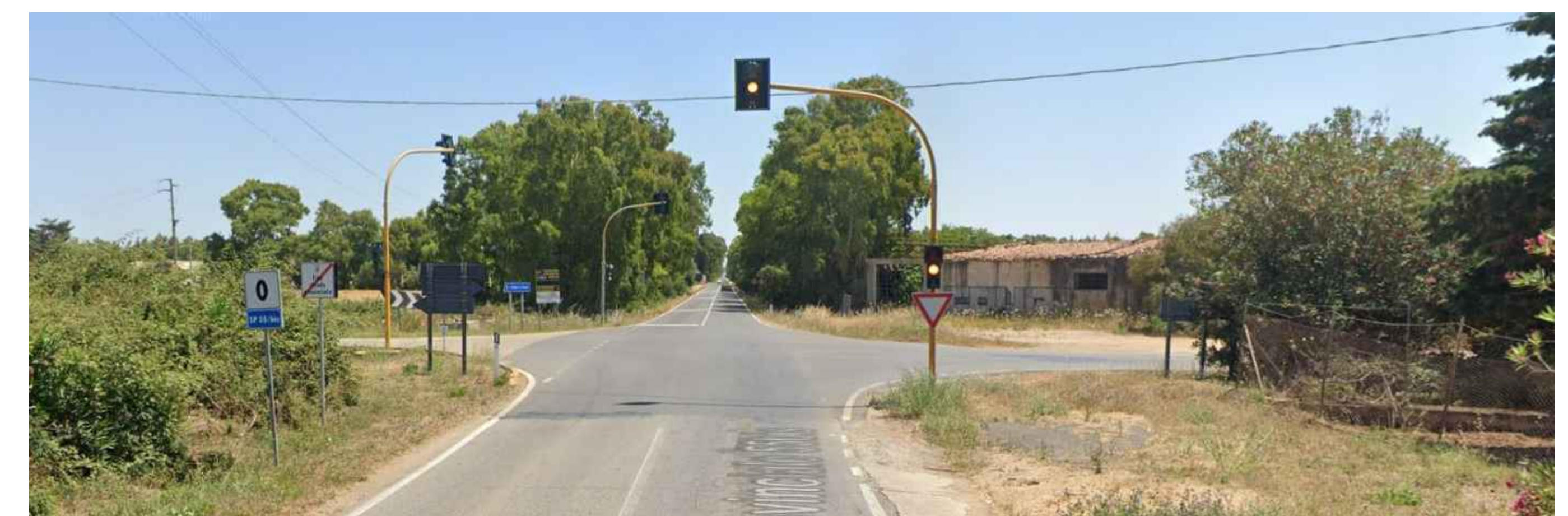
Stato attuale dei luoghi