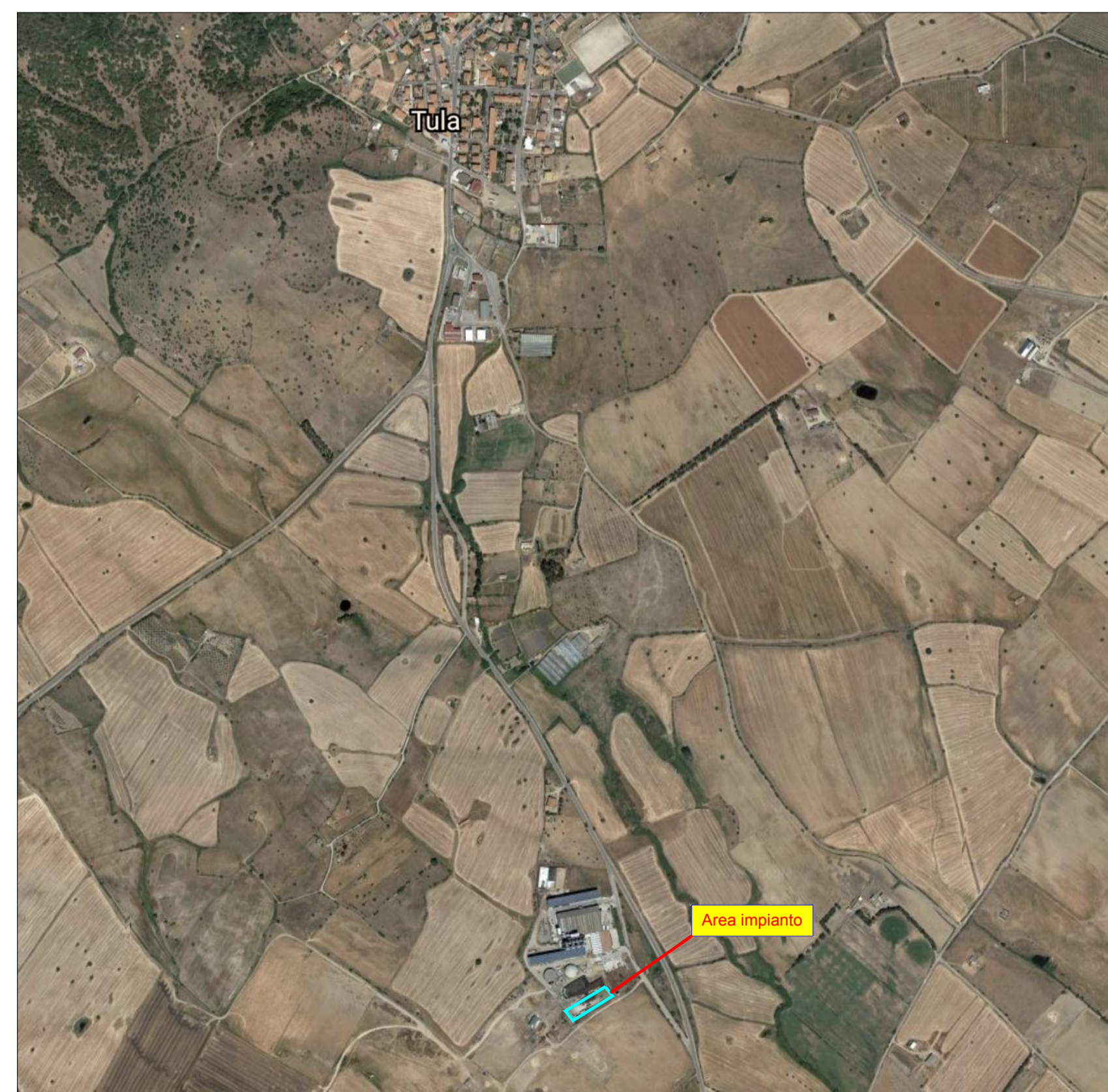
ORTOFOTO ANNO 2013