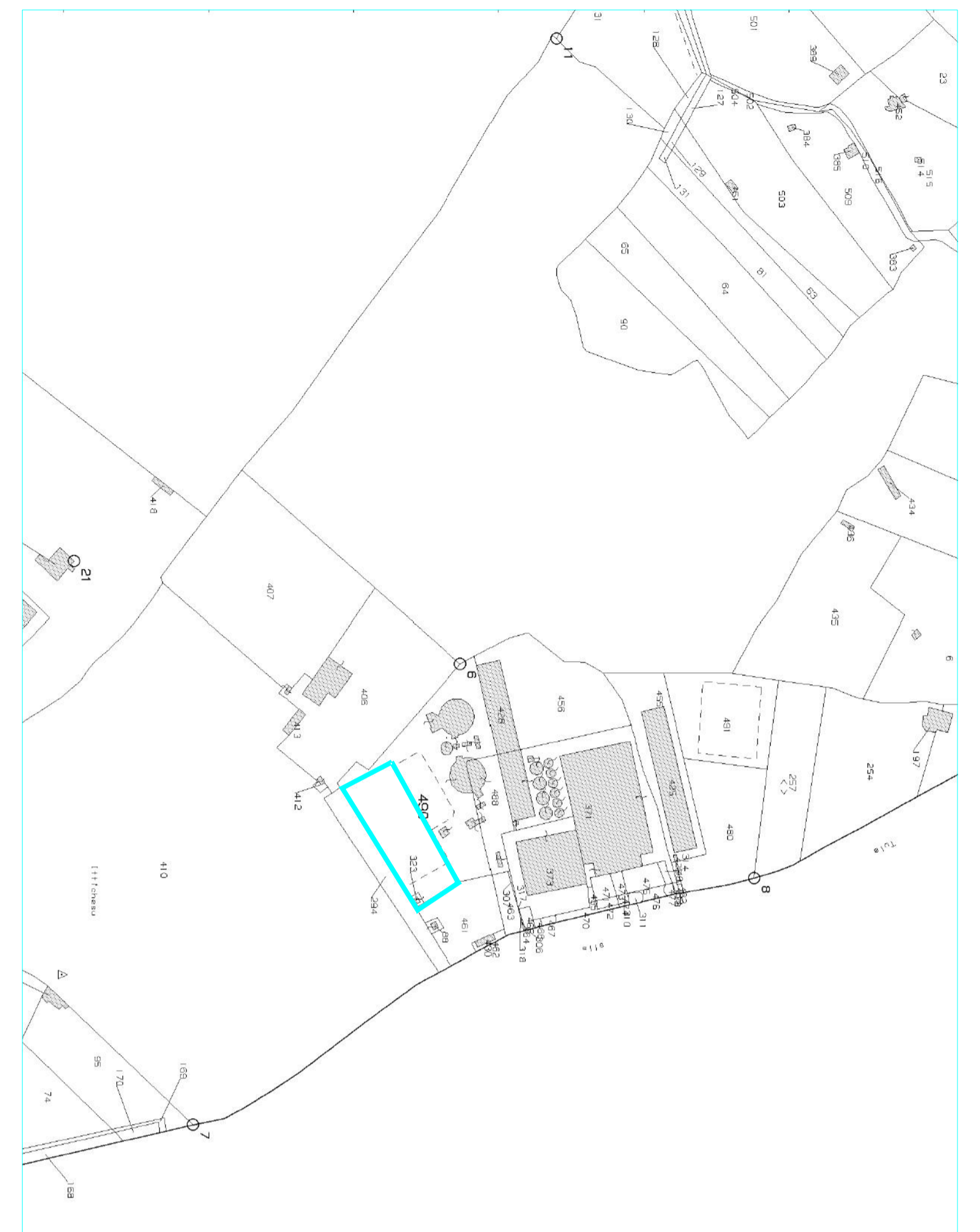
STRALCIO CATASTALE - FOGLIO 19 - MAPPALE 490 - COMUNE DI TULA