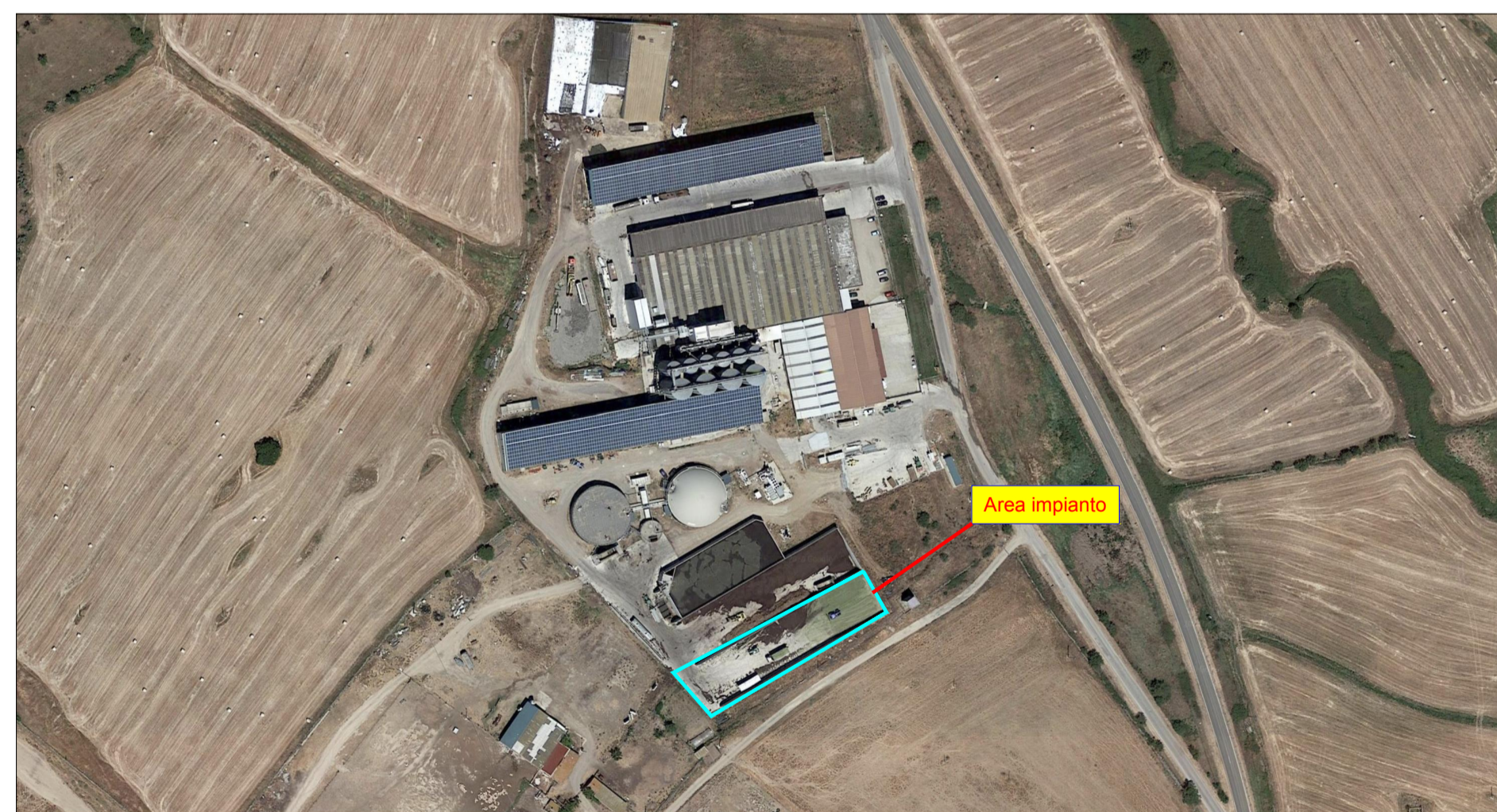
ORTOFOTO ANNO 2013- area di impianto trattamento SOA