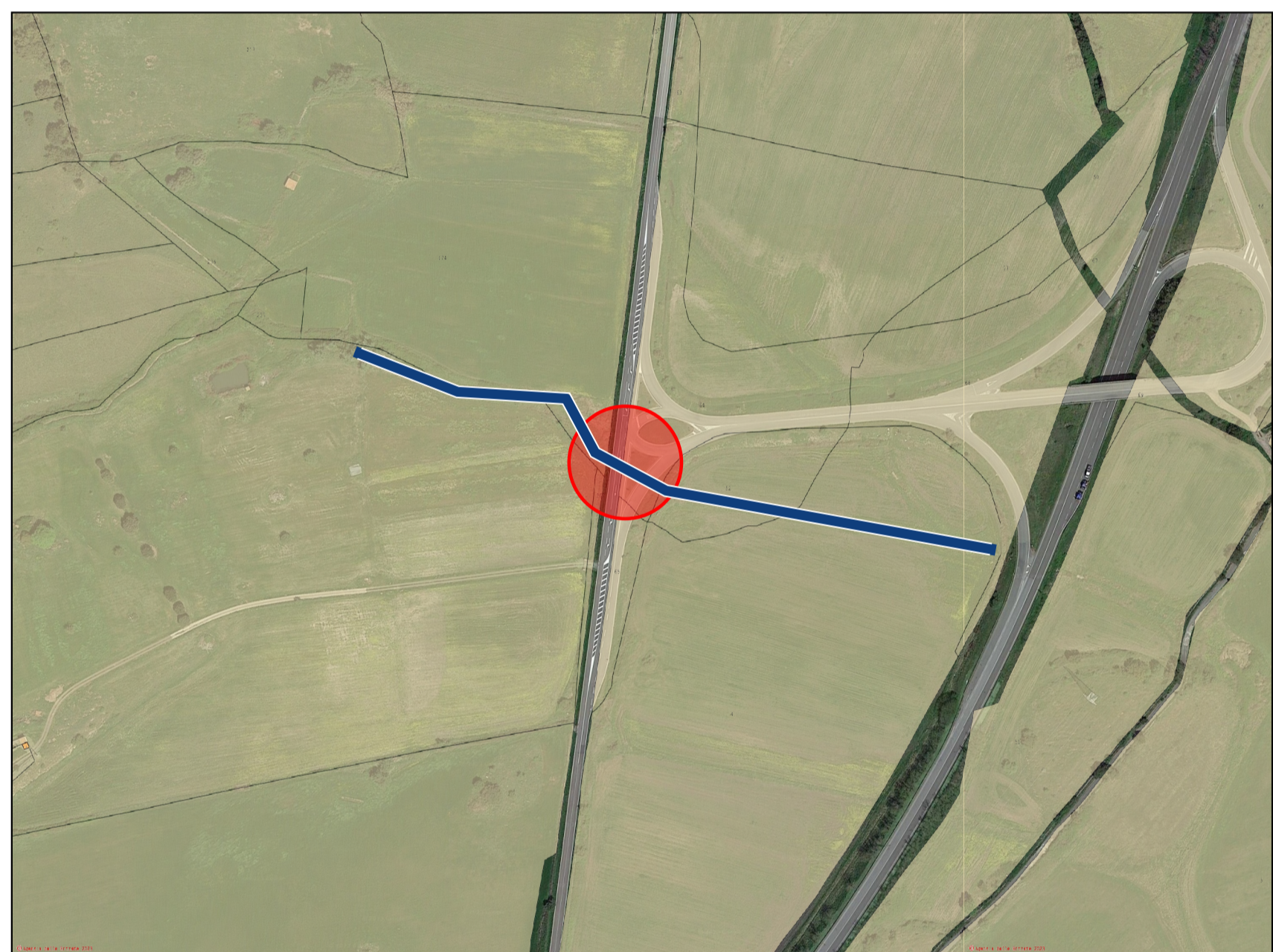
Stralcio planimetria catastale. Scala 1:4000