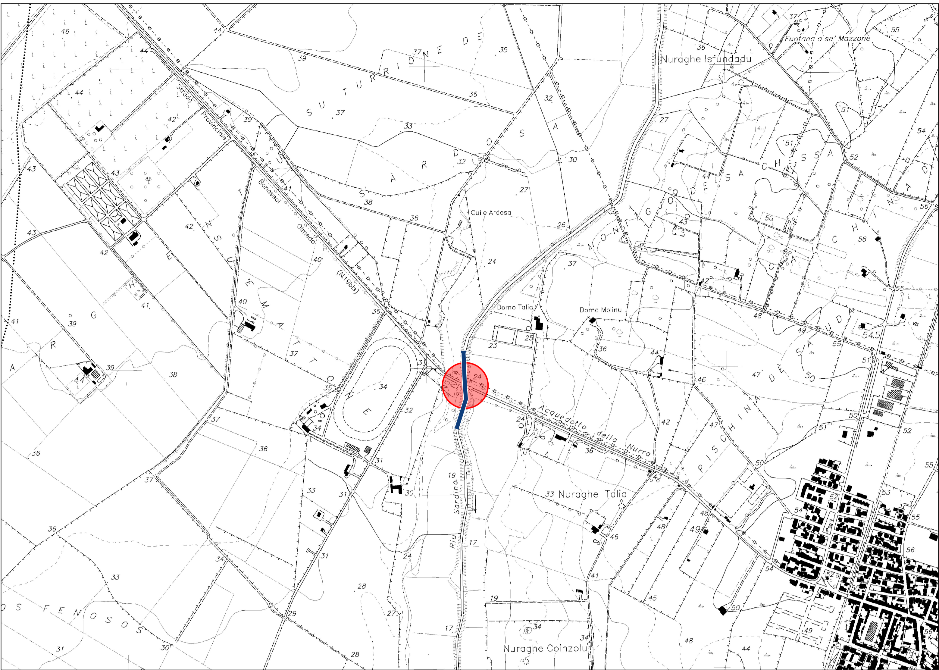
Stralcio CTR con interventi (in rosso). Scala 1:10000