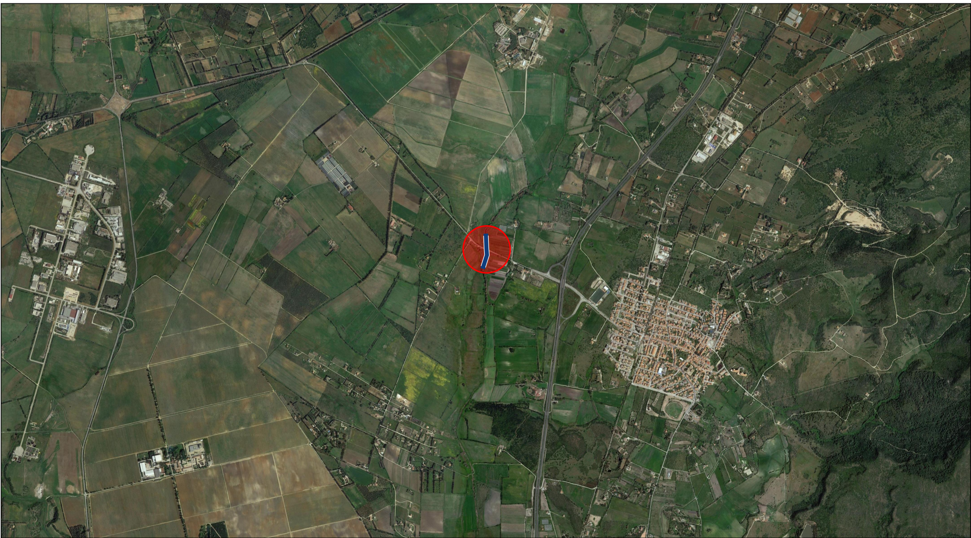
Stralcio ortofoto con interventi (in rosso). Scala 1:25000