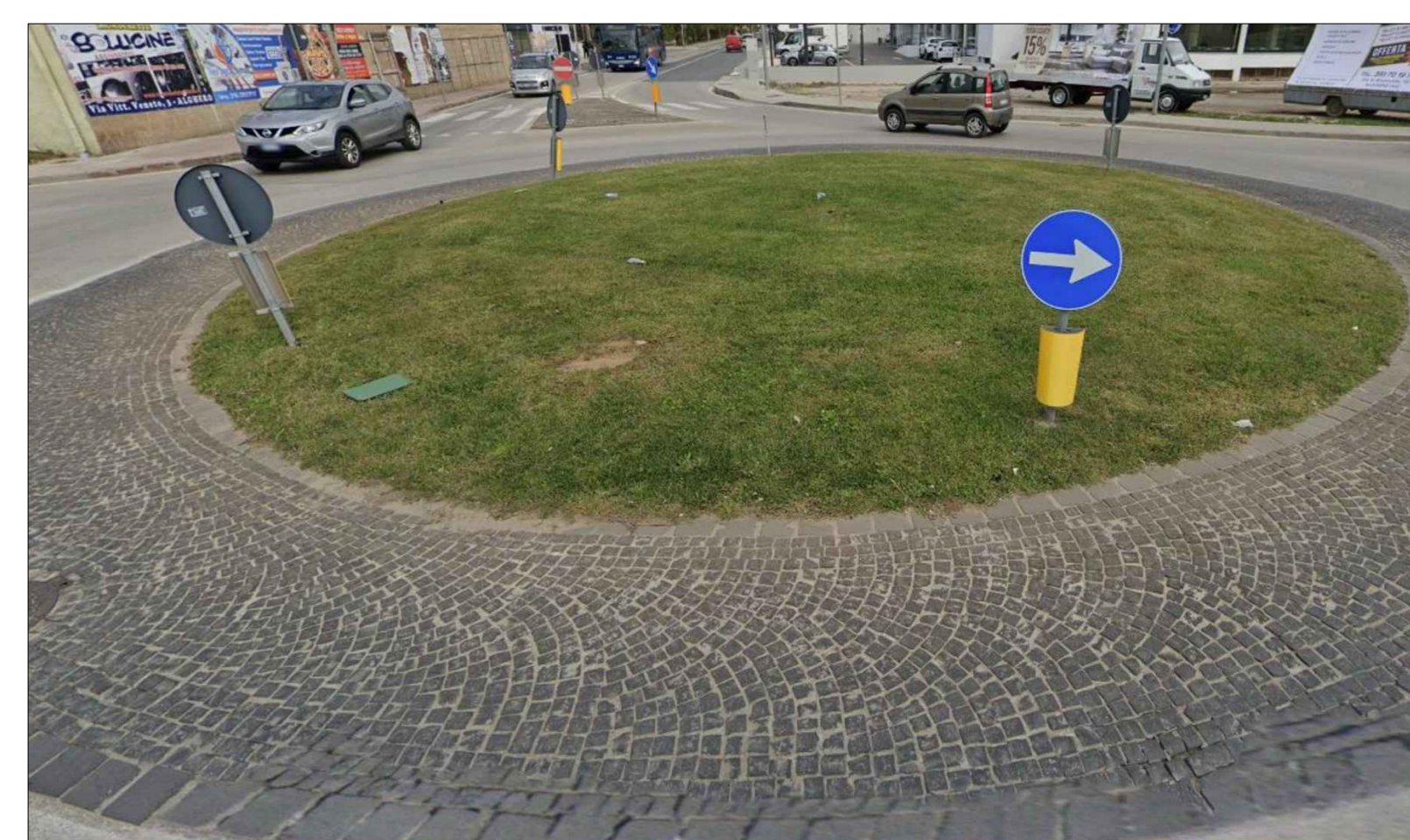
IMMAGINI DELLA ROTATORIA IN ADERENZA AL LOTTO A