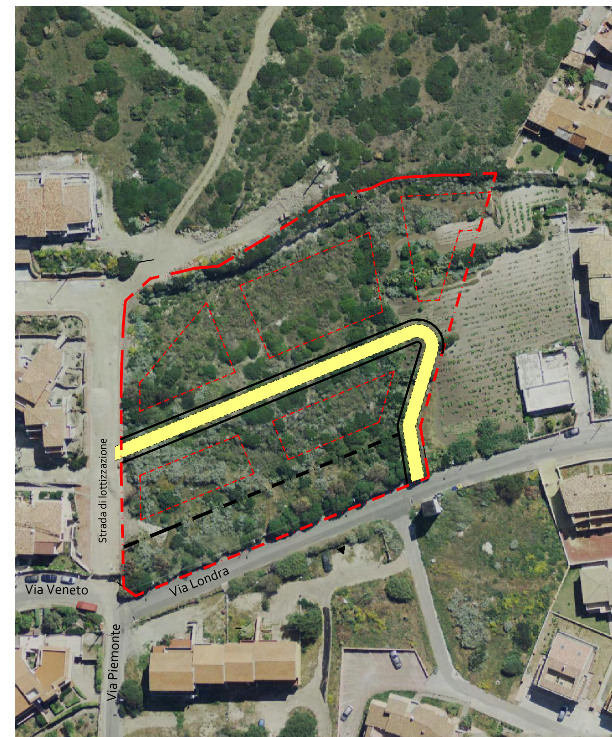
Fotografia aerea in scala adeguata

(sovrapposizione del piano di lottizzazione con ortofoto recente)