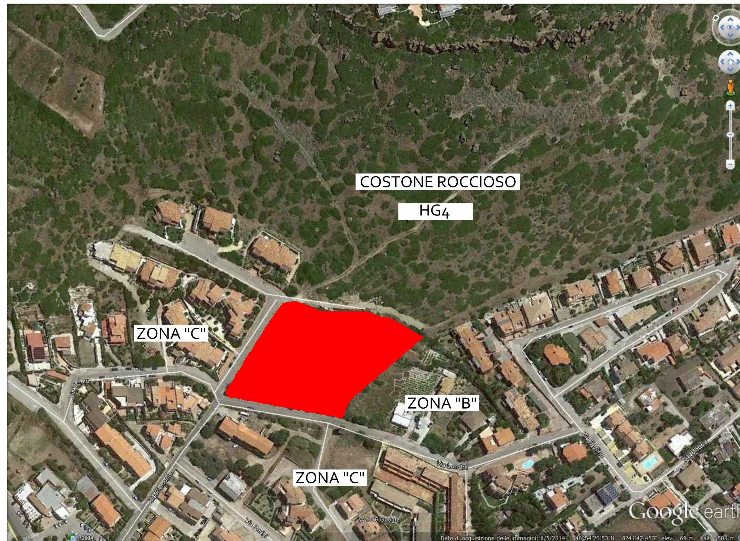
Fotografia aerea recente

(sovrapposizione del piano di lottizzazione con ortofoto recente)