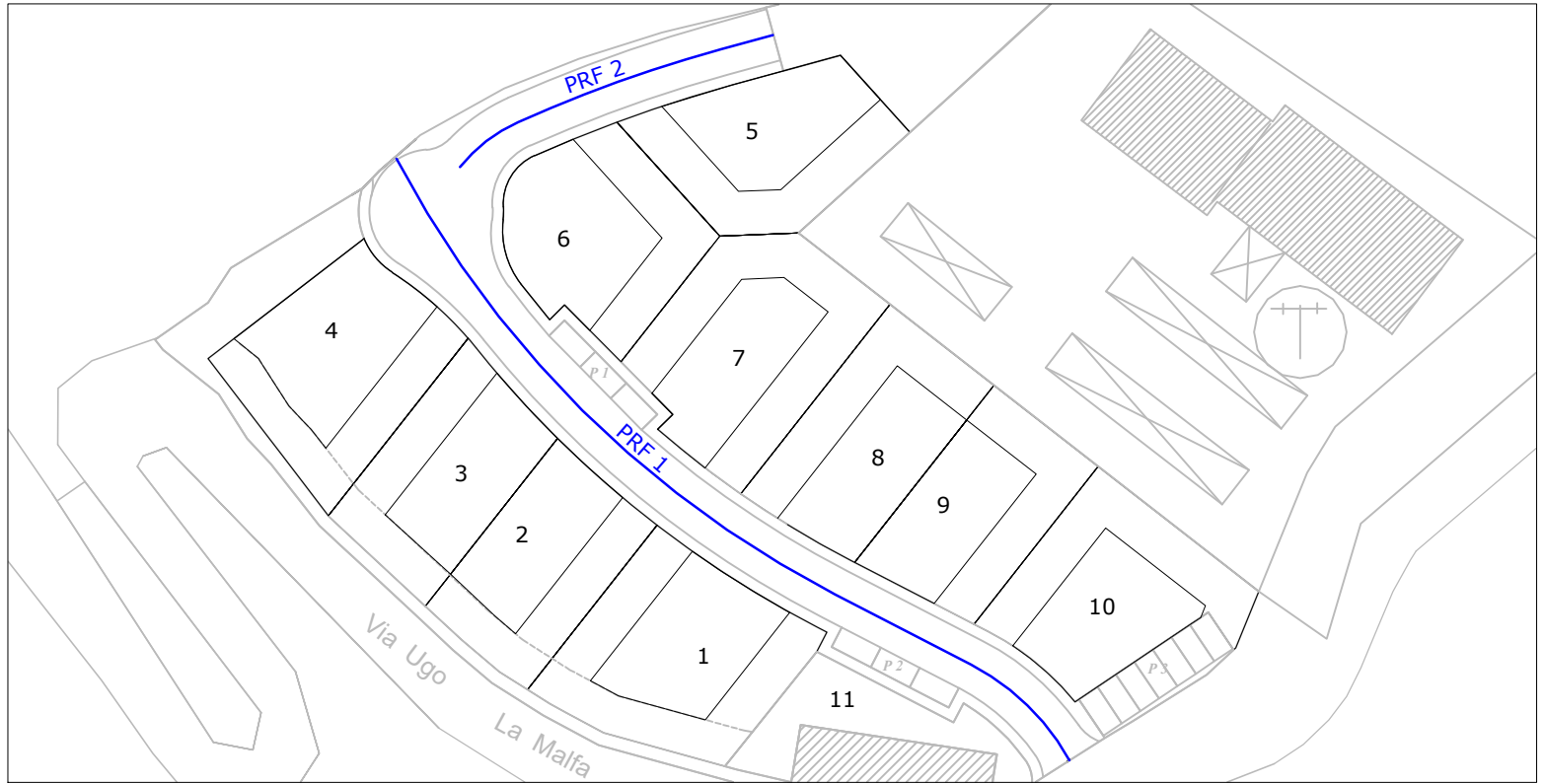
PROFILO LONGITUDINALE 1