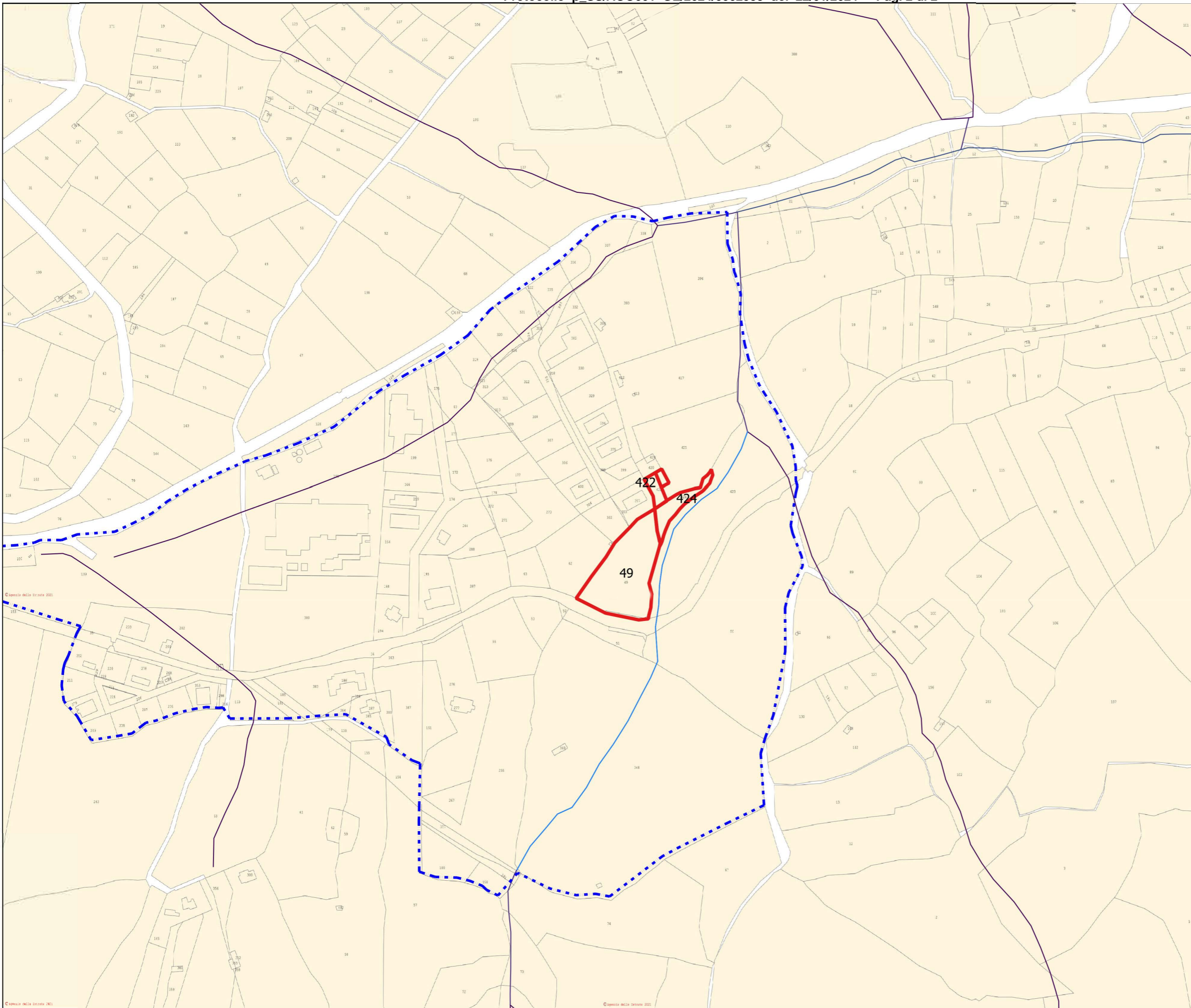
TAVOLA 02 Inquadramento Catastale e urbanistico